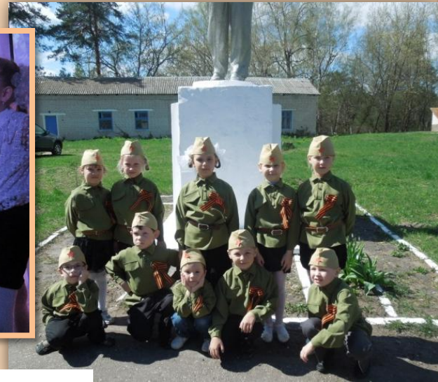
Участие в шествии Бессмертный полка с.Кантаурово.