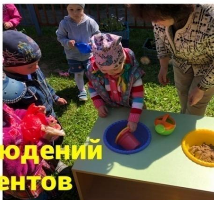
Станция Наблюдений и Экспериментов